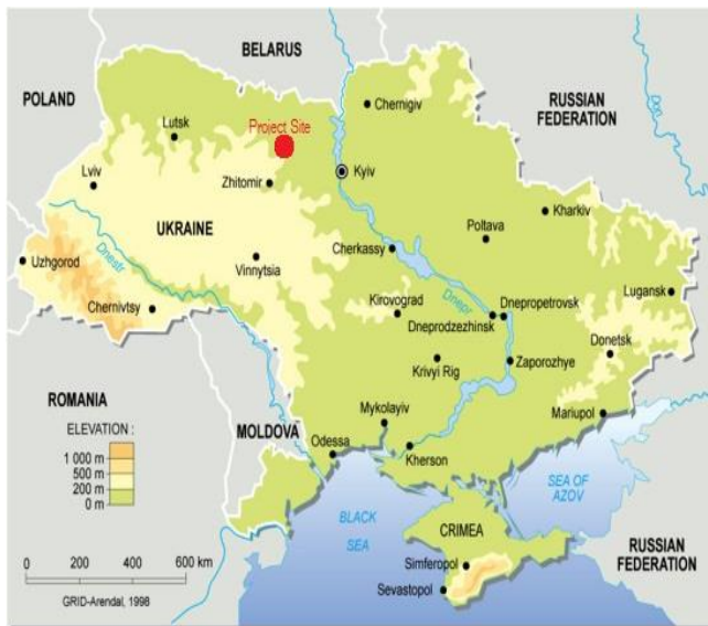
Малюнок 1.1 Зображення карти